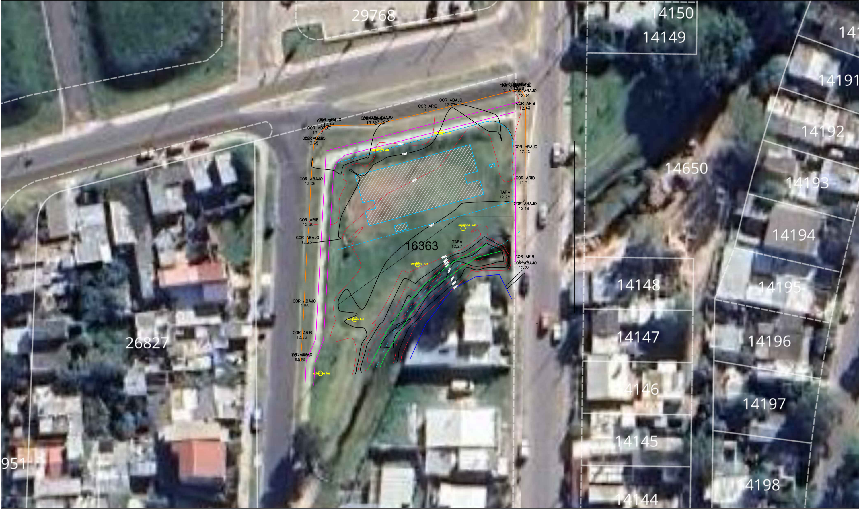
PLANTA UBICACION esc 1:500