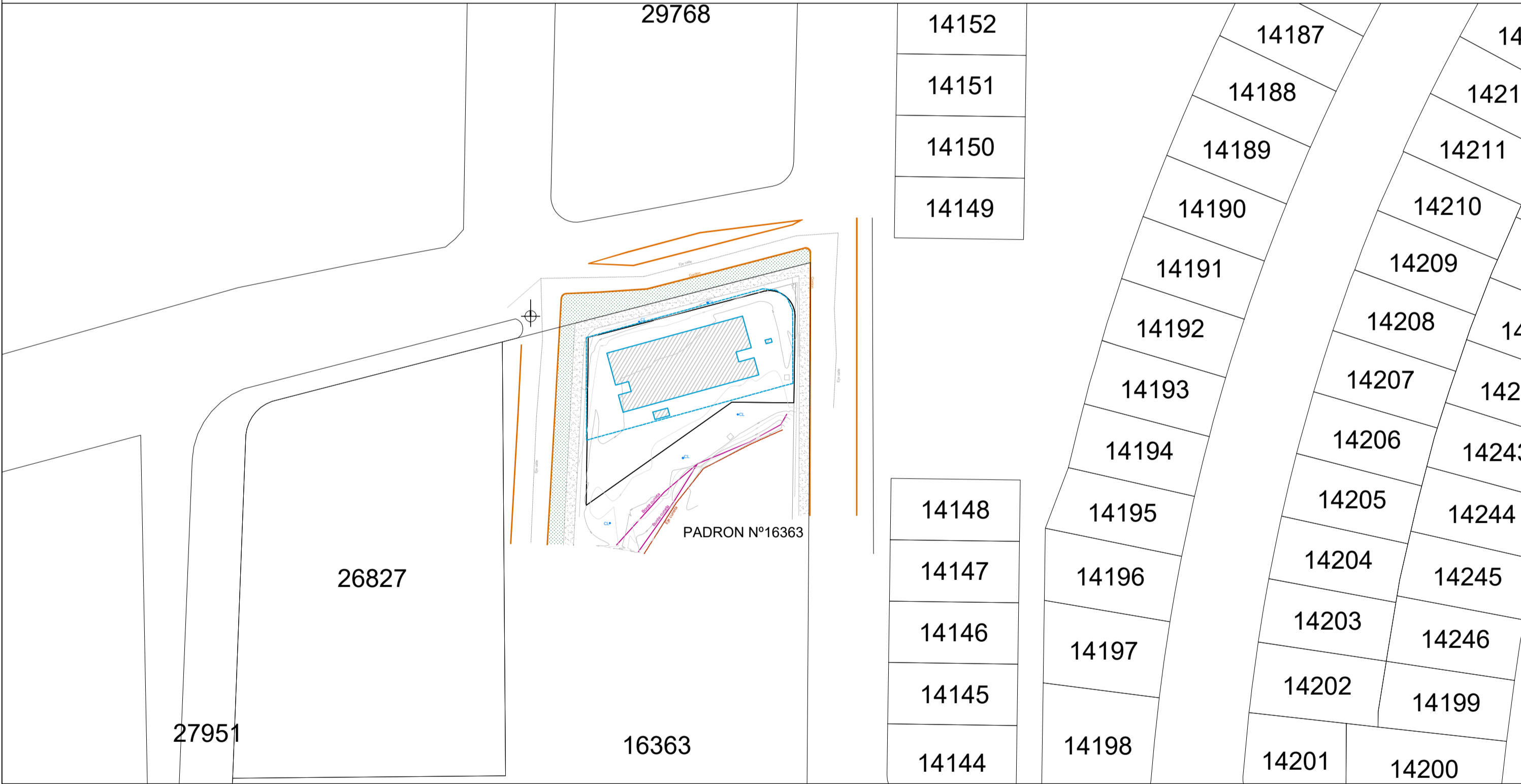
PLANTA UBICACION esc 1:750